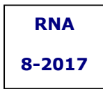
Ilustración 3. Modelo de marca de identificación

Se indicará la categoría del vehículo en letras mayúsculas de color azul marino sobre fondo blanco (ver ilustración 3). La altura de las letras será como mínimo de 100 mm para la marca de identificación, y de 50 mm para la fecha de expiración. En vehículos especiales, (cargados con masa máxima no superior a 3.5 T), la altura podría ser como mínimo de 50 mm para la marca de identificación y de 25 mm para la fecha de expiración.